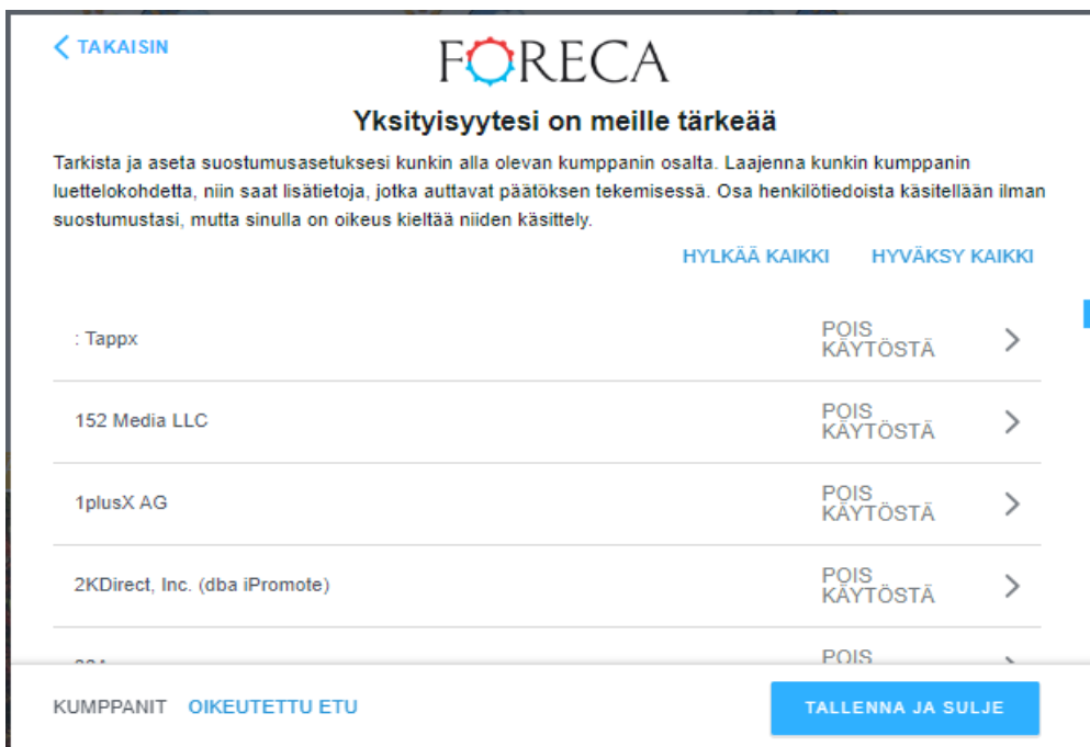
Kuva 6. Forecan evästesuostumustyökalun 2. taso, kumppanit -välilehti, tarkasteltu 27.9.2023.

Työkalun 2. tasolla sijaitsevat myös kaksi muuta välilehteä, joista ensimmäisellä on listattu Forecan kumppanit ja toisella taas oikeutettuun etuun liittyvät valinnat.