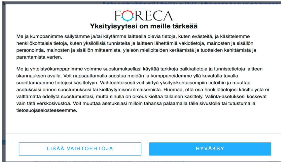
Kuva 2. Toimenpidepyynnön liitteenä ollut kuvakaappaus Forecan evästesuostumustyökalun 1. tasosta 12.3.2021.

Asiassa on ensiksi arvioitava Forecan evästekäytäntöjä sellaisina, kun ne ovat olleet saapuneiden yhteydenottojen aikana vuonna 2021. Forecalta saadun selvityksen mukaan yhtiö on jo tuolloin soveltanut käytäntöä, jossa käyttäjän suostumus evästeisiin on pyydetty evästabannerilla. Forecan mukaan sillä ei ole dokumentointia onko jokin sen toiminnon asettelu, sanamuoto, väri tai vastaava mahdollisesti muuttunut sen jälkeen. Traficomien tiedot aiemmasta tilanteesta perustuvat siis vain toimenpidepyynnön tekijöiden kuvauksiin käytännöistä, toisen toimenpidepyynnön tekijöistä viestinsä liitteenä toimittamiin kuvakaappauksiin sekä Forecan tietosuojavaltuutetun toimistolle antamaan selvitykseen, koska Traficomien on muilla tavoin mahdotonta varmistaa aiemmin vallinnutta tilannetta.