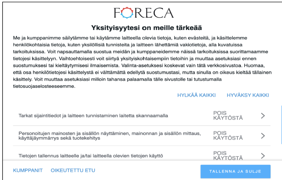
Kuva 5. Forecan evästesuostumustyökalun 2. taso, tarkasteltu 27.9.2023.

Evästesuostumustyökalun 2. tason ensimmäisellä välilehdellä (Kuva 5) käyttäjälle esitetään seuraavat käyttötarkoitukset: "Tarkat sijaintitiedot ja laitteen tunnistaminen laitetta skannaamalla", "Personoitujen mainosten ja sisällön näyttäminen, mainonnan ja sisällön mittaus", "käyttäjäymmärrys sekä tuotekehitys, tietojen tallennus laitteelle ja/tai laitteella olevien tietojen käyttö", sekä "Erikoistarkoitukset ja ominaisuudet". Käyttäjän on mahdollista tällä välilehdellä