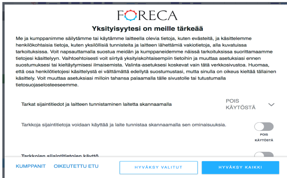
Kuva 3. Toimenpidepyynnön liitteenä ollut kuvakaappaus Forecan evästesuostumustyökalun 2. tasosta 12.3.2021.

Toiseen toimenpidepyynnöistä liitettyjen kuvien (kuvat 2 ja 3) perusteella käy ilmi, että evästesuostumustyökalun tekstit ja kuvat, sekä valintamahdollisuudet ovat ainakin jonkin verran muuttuneet ajan kuluessa. Vuonna 2021 käytössä olleessa suostumushallintamekanismissa käyttäjälle ei ainakaan suoraan ole tarjottu mahdollisuutta kieltäytyä muista kuin välttämättömistä evästeistä vaan ainoastaan "Hyväksy kaikki" valinnan rinnalla "Hyväksy valitut" evästesuostumustyökalun 2. tasolla. Forecan Tietosuojavaltuutetun toimistolle 22.3.2021 antamassaan selvityksessä yhtiö mainitsee, että evästeiden tallentamisen ja käytön voi kieltää työkalun kautta "Kiellä kaikki" -valinnalla. On siis mahdollista, että Foreca on tehnyt joiakin muutoksia evästesuostumustyökaluunsa TSV:n selvityspyynnön saatuaan.