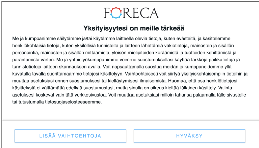
Kuva 4. Forecan evästesuostumustyökalun 1. taso, tarkasteltu 27.9.2023.

Forecalla käytössä oleva evästesuostumustyökalu koostuu kahdesta tasosta, joista jälkimmäinen sisältää kolme eri välilehteä. Työkalun ensimmäisellä tasolla käyttäjälle esitetään kootusti käyttötarkoituksia johon Foreca ja sen kumppanit käyttävät eväsetietoja ja mahdollisuus hyväksyä nämä kaikki tarkoitukset (Kuva 4) tai siirtyä tekemään tarkempia valintoja mekanismin toiselle tasolle painamalla "Lisää vaihtoehtoja" -painiketta, joka avaa mekanismin 2. tason (Kuva 5).