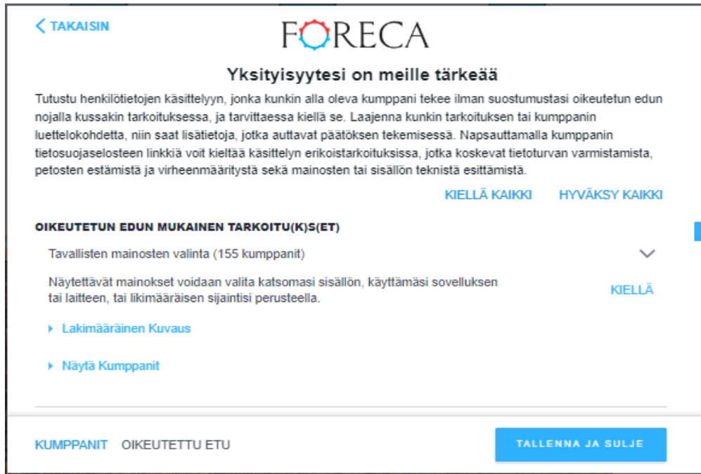
Kuva 7. Forecan evästesuostumustyökalun 2. taso, oikeutettu etu -välilehti, tarkasteltu 27.9.2023.

Foreca on Traficomille antamansa selvityksen ohessa viraston pyynnöstä toimittanut listauksen käytössä olevista evästeistä ja niiden kaltaisista tekniikoista. Toimitettu listaus vaikuttaa Forecan päätösluonnoksesta antaman lausunnon yhteydessä toimittamista lisätiedoista huolimatta osin puutteelliselta. Viraston sivustolla suorittaman tarkastelun perusteella päätelaitteen paikalliseen tallennustilaan (local storage) tallentuu ilman suostumusta sellaisiakin evästeitä, joita ei ole mainittu Forecan antamassa selvityksessä eikä päätösluonnoksesta annetussa lausunnossa. Kyseisiä evästeitä ovat alla olevassa Taulukossa 1 listatut evästeet. Koska kyseisiä evästeitä ei ollut mainittu Traficomille toimitetussa listauksessa eikä Forecan päätösluonnoksesta antamassa lausunnossa, jää niiden käyttötarkoitus ja tyyppi epäselväksi.